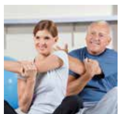
VITAL & AKTIV – fit bleiben