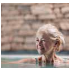
RELAX – Seele baumeln lassen