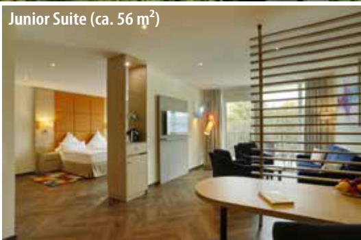
Junior Suite (ca. 56 m 2 )