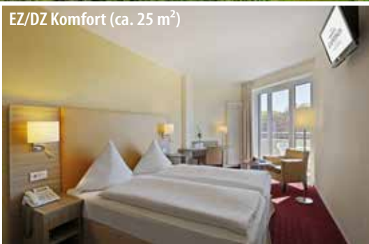
EZ/DZ Komfort (ca. 25 m 2 )