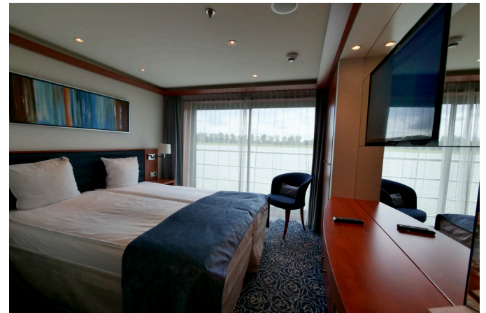
Beispiel: Kabine auf dem Countess Deck

Die MS Verdi ist ein luxuriöses Flusskreuzfahrtschiff, das den Gästen mit seiner Innenausstattung eine gemütlich-wohnliche Atmosphäre auf Ihrer Reise bietet. Die insgesamt 70 Kabinen verteilen sich auf 3 Decks. Auf dem Duchess Deck befinden sich 14 Kabinen, auf dem Countess Deck sowie auf dem Empress Deck befinden sich jeweils 24 Kabinen. Außerdem gibt es sowohl auf dem Empress Deck als auch auf dem Countess Deck jeweils 4 geräumige Suiten. Alle Kabinen auf dem Countess und Empress Deck verfügen über einen französischen Balkon. Die Kabinen auf dem Duchess Deck verfügen über nicht zu öffnende Fenster. Die Kabinen haben ein eigenes Badezimmer mit Dusche/WC und sind mit TV, Safe, Haartrockner, individuelle Klimaanlage und einem Mini-Kühlschrank ausgestattet. Außerdem verfügt das Schiff über einen Aufzug zwischen dem Countess-Deck, den Zwischenebenen (Rezeption, Lounges, Restaurant) und Empress-Deck.